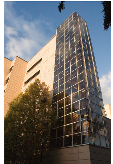
El UWMC se encuentra en 1959 N.E. Pacific Street, Seattle, WA 98195.