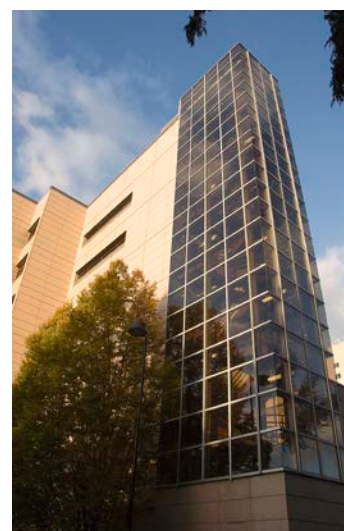
UWMC is located at 1959 N.E. Pacific Street, Seattle, WA 98195.